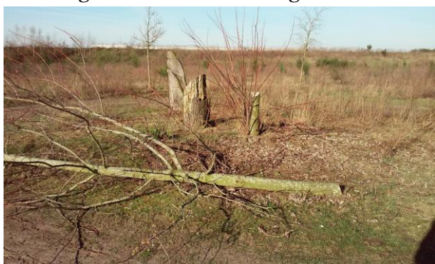
Ja, daar lig je dan. Net in bloei!

weer drukker bezocht. Dat zie je 's morgens aan de troep die er dan ligt. Daar had ik in de vorige column al iets over gezegd. Toch valt nog iets anders op. Naast het achterlaten van troep, vinden de mensen het nodig om de zaak te gaan vernielen. Vandalisme zoals dat heet. De picknicktafel die er staat heeft al heel wat te verduren gehad. Nu hebben de daders een poging gedaan om de zaak in de fik te steken. De vuilnisbelt wordt pas compleet als er slechts een rokende puinhoop achterblijft. Fijn voor hen die na jullie gebruik willen maken van het zitje. Doe je dit nou omdat je je verveelt? Gebeurt dit door jongeren, de "nozems" van tegenwoordig? Onze jongeren in het dorp hebben toch zat dingen om handen? Talloze sportverenigingen, muziek maken bij harmonie of schutterij, huiswerk en studie, desnoods de ouders helpen op het land? Hier past maar een uitdrukking. Die van Rutte ook nog eens: Doe effe normaal!